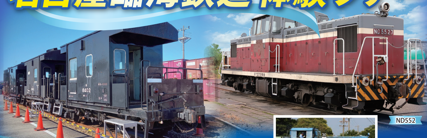
ヨ8000形式車掌車