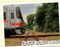
ダイヤモンドクロッシング