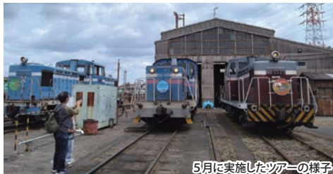
5月に実施したツアーの様子