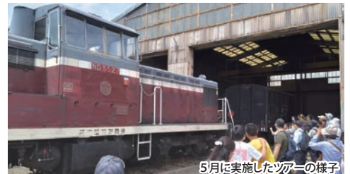
5月に実施したツアーの様子