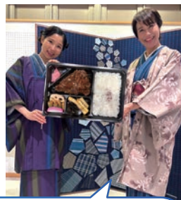
松阪「駅弁のあら竹」の新社長が駅弁の美味しさの秘訣や掛け紙コレクションの仕方などをご案内します。