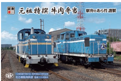
お弁当の掛け紙は『元祖特撰牛肉弁当65周年記念「名古屋臨海鉄道コラボバージョン』』

■最少催行人員/20名 ■利用バス会社/名鉄観光バス ■添乗員/同行します ■食事/昼食1回 ※お客様の年齢は安全上小学1年生以上とさせていただきます。