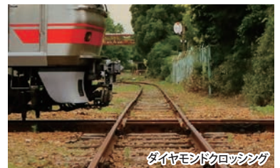
ダイヤモンドクロッシング