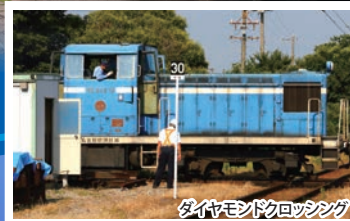
ダイヤモンドクロッシング